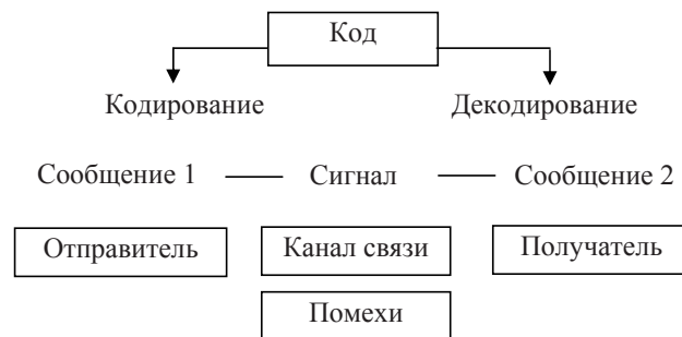
Рис. 1. Обобщенная схема коммуникации

Единство языка и речи реализуется в речевой деятельности через языковую и речевую активность индивида. Язык становится средством общения, речевой коммуникации и одновременно инструментом мышления только в процессе речевой деятельности: «язык создается в речи и постоянно в ней воспроизводится» 1 . В исследовании на основе структуры коммуникации построена обобщенная схема коммуникации: